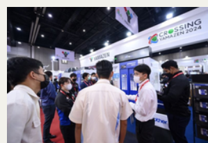
ASEAN地域最大級！世界から注目 集まる工作機械と金属加工技術関 連の展示会「METALEX」