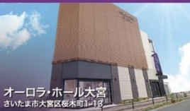
オーロラ・ホール大宮 さいたま市大宮区桜木町1-1-1