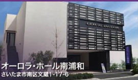
オーロラ・ホール南浦和 さいたま市南区文蔵1-17-8