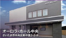
オーロラ・ホール中央 さいたま市中央区新中里2-2-9