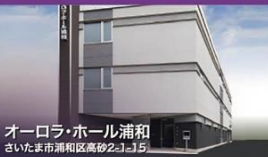
オーロラ・ホール浦和 さいたま市浦和区高砂2-1-15